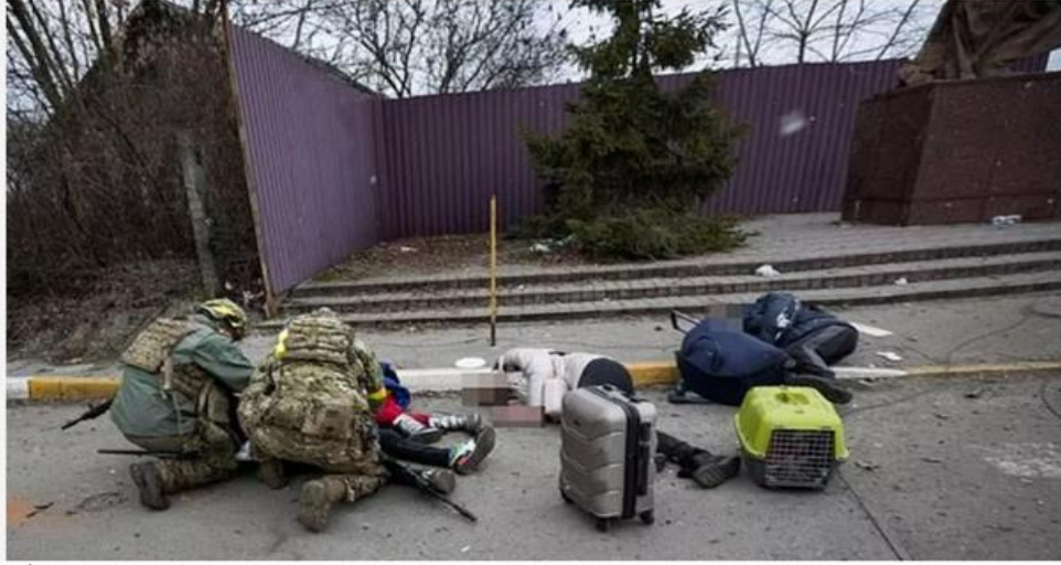
İlpin'de hayatını kaybeden siviller... Fotoğrafta yerde yatanlardan birinin bir çocuk olduğu seçilebiliyor

"Mariupol'den 18 aylık Kirill, 'Okhtyrka'dan 7 yaşındaki Alisa, Harkov'dan 6 yaşındaki Sofia, 14 yaşındaki Arseniy.... Bu çocukların hepsi Rusya'nın bilinçli hedefleri oldular" diyerek dünyaya seslenen Zelenska "Ukrayna'da şimdiye kadar en az 38 çocuk öldü. Bu rakam şu anda şehirlerimiz bombalanırken artıyor" ifadesini kullandı ve sivillerin, özellikle de çocukların ölümü durabilsin diye dünya devletlerin yardım talebini yineledi.